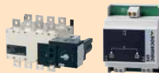
ATyS r Inverseurs de sources

Double alimentation DPS en option pour utilisation avec ATyS r, disjoncteurs et contacteurs sans module de gestion d'alimentation double (DPS) intégré