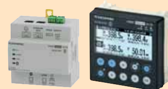
DIRIS Digiware M-70 et D-70