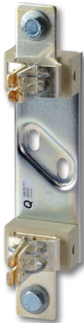
Socle taille 1, 1000 VDC